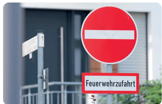
Abbildung 5: Amtliche Kennzeichnung einer Feuerwehruzufahrt

widrig abgestellten Fahrrad verletzen könnten. Nach den Vorschriften der GoA können dem Eigentümer in solchen Fällen auch die Kosten der Aufbewahrung in Rechnung gestellt werden. Die Kosten für ein durch das Entfernen zwangsläufig zerstörtes Fahrradschloss müssen nicht erstattet werden.