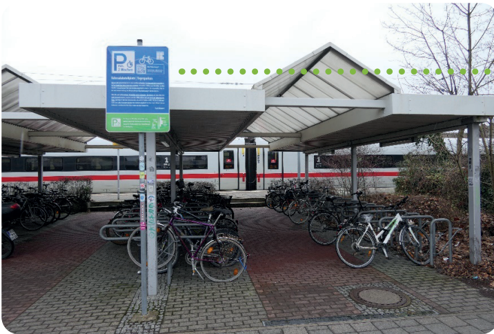
Abbildung 4: Beschränkte Parkdauer Erlangen

Ist der Zugang zur Abstellanlage wie bspw. bei einigen Fahrradparkhäusern beschränkt, kann das Einverständnis der Nutzenden zu den Bedingungen auch schriftlich im Rahmen eines Vertrages durch vorherige Anmeldung / Registrierung abgefragt werden. Es ist jedoch auch in diesem Fall zu empfehlen, die Nutzungsbedingungen eindeutig und gut lesbar vor dem Eingang und an gut einsehbaren Plätzen innerhalb der Anlage zu platzieren.