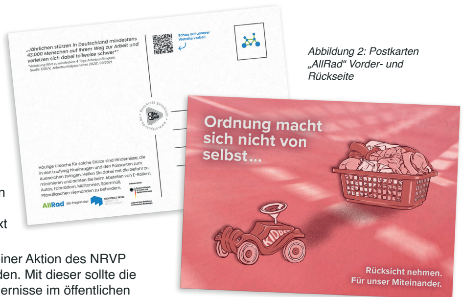
Abbildung 2: Postkarten „AllRad“ Vorder- und Rückseite

Initiativen oder Dachverbände wie der Deutsche Städtetag oder AGFK können dabei als Plattform zur Vernetzung und anschließenden Bündelung der Ressourcen dienen.